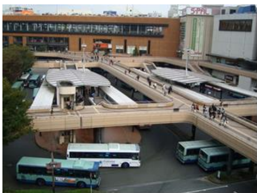
←ペDESTリアンウェイ（デッキ）

https://i.pinimg.com/originals/2e/c3/38/2ec33833f0c0a88a5e45599aa41542e8.jpg ja.wikipedia.org